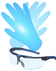
Nitrilhandschuhe / Schutzbrille