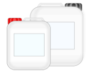
z.B. Woodresin Premium Cast Resin

* Die Verträglichkeit zwischen dem gewählten Gießharz und EFFECT Pearl Pigment muss vor Verarbeitungsbeginn geprüft werden!